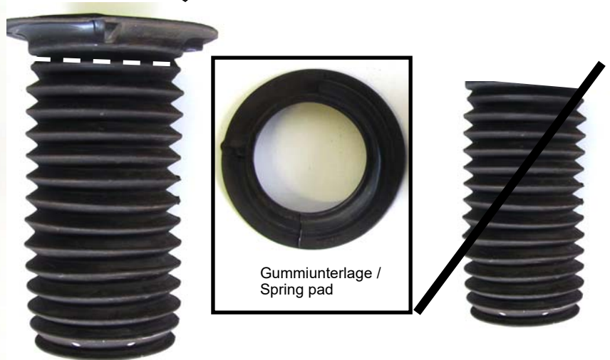
Gummiunterlage / Spring pad

Cut off the standard dust cover on the dashed line. Insert the top part of the dust cover on the spring. The lower part of the dust cover is no longer required.