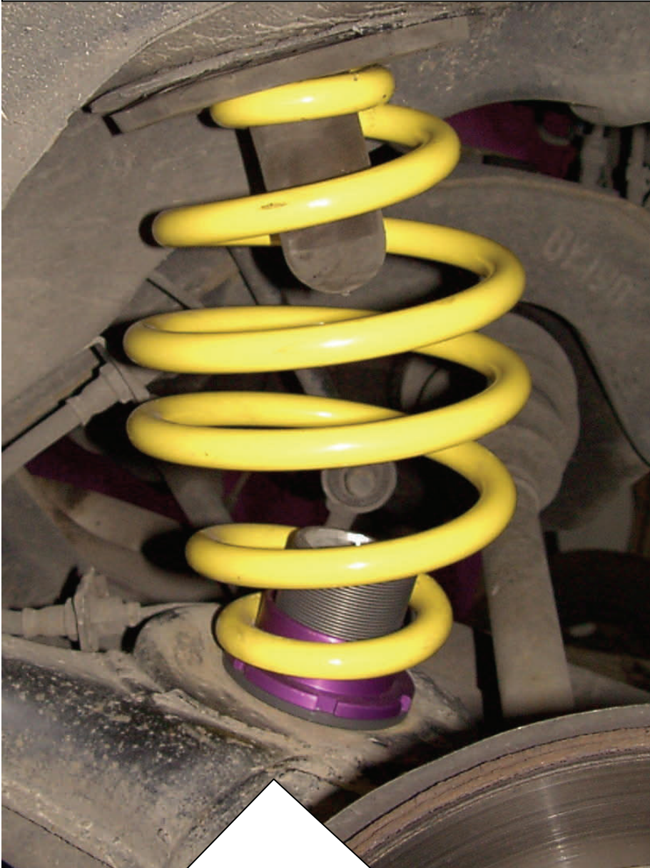
Abbildung nur beispielhaft / Example only

Die Höhenverstellung wird, wie im Bild zu sehen, unten (Achsseitig) eingesetzt, wobei die Berührungsflächen vor dem Einbau gereinigt werden müssen. Die obere Federunterlage mit Anschlagpuffer wird wie beim Seriefahrzeug eingesetzt und sollte sich in einwandfreiem Zustand befinden, ggf. gegen Neuteil ersetzen. Der Einbau des angelieferten Hinterachsdämpfers erfolgt gemäß der Einbauanleitung des Fahrzeugherstellers.