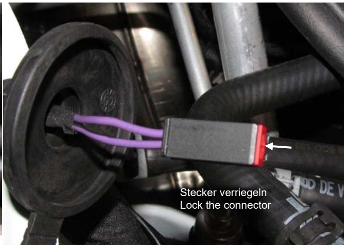
Stecker verriegeln Lock the connector